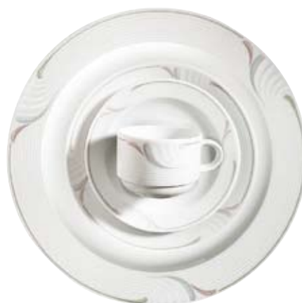
406950 Revue Lagerdekor, Stock decoration, Décoration de stock, Decorado de stock, Decoro su articoli in magazzino