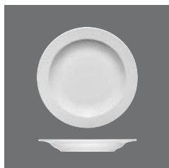
Teller halbtief Fahne, Plate half-deep with rim, Assiette demi-creuse à l'aile, Plato medio hondo con ala, Piatto semifondo