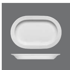
Platte oval halbtief Fahne, Platter oval half-deep with rim, Plat ovale demi-creux à l'aile, Fuente oval con ala, Piatto ovale semifondo