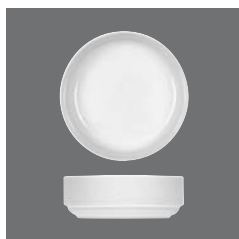
Salatiere rund, Salad dish round, Saladier rond, Ensaladera redonda, Insalatiera rotonda