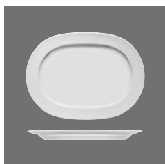
Platte oval Fahne, Platter oval with rim, Plat ovale à l'aile, Fuente oval con ala, Piatto ovale