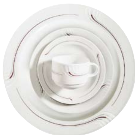
405750 Baccara Lagerdekor, Stock decoration, Décoration de stock, Decorado de stock, Decoro su articoli in magazzino