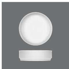
Eintopfschale, Stew bowl, Bol à plat unique, Ensaladera redonda, Insalatiera rotonda