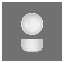
Bowl rund , Bowl round, Bol rond, Bowl redondo, Coppetta rotonda

> Bowl rund 0.27 25 6510 2558/0.27 0,27 (9.13) 95 (3.74) 56 / 456 195