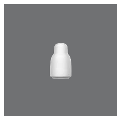
Pfefferstreuer , Pepper shaker, Poivrière, Pimentero, Spargi pepe

> Salzstreuer 25 4011 2528 - 53 (2.09) 89 105