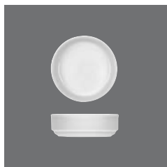
Kompottschale rund, Fruit saucer round, Compotier rond, Compotera redonda, Coppetta rotonda