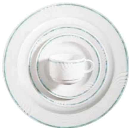
409070 Laguna Lagerdekor, Stock decoration, Décoration de stock, Decorado de stock, Decoro su articoli in magazzino