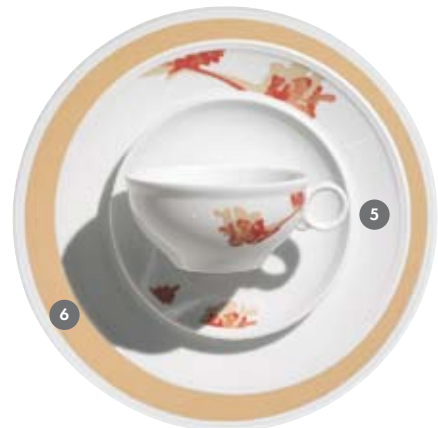
5 421312 Lauraine* 6 421311 Lauraine Fahnenfond 6 Auf Teller flach + tief steile Fahne, Untere.; All plates flat + deep steep rim, saucer.; Aile décorée: toutes les assiettes plates et creuses, soucoupes.; En platos y ala inclinadas, plattos.; Tutti i piatti piani e fondi con falda alta, piattini: 28 6918, 28 6935