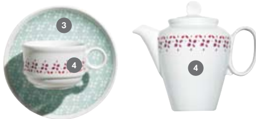
3 421295 Camille 5 4 421292 Camille 2 Nur erhältlich auf Untere.; Only available on saucers; Uniquement disponible sur les soucoupes; Solo en los platos.; Solo disponibile su piattini; 3 28 6918, 28 6935