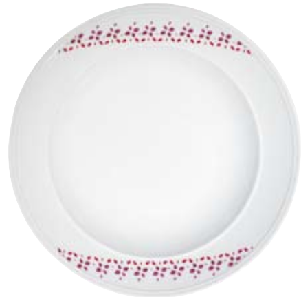
421294 Camille 4 Nur erhältlich auf Teller.; Only available on plates; Uniquement disponible sur les assiettes; Solo en los platos.; Solo disponibile su piatti: 28 1916, 28 1925, 28 1929, 28 1922