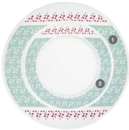
1 421291 Camille 1 2 421293 Camille 3 Nur erhältlich auf Teller.; Only available on plates; Uniquement disponible sur les assiettes; Solo en los platos.; Solo disponibile su piatti: 1 28 1826, 28 1829, 28 1831 2 28 1816, 28 1823